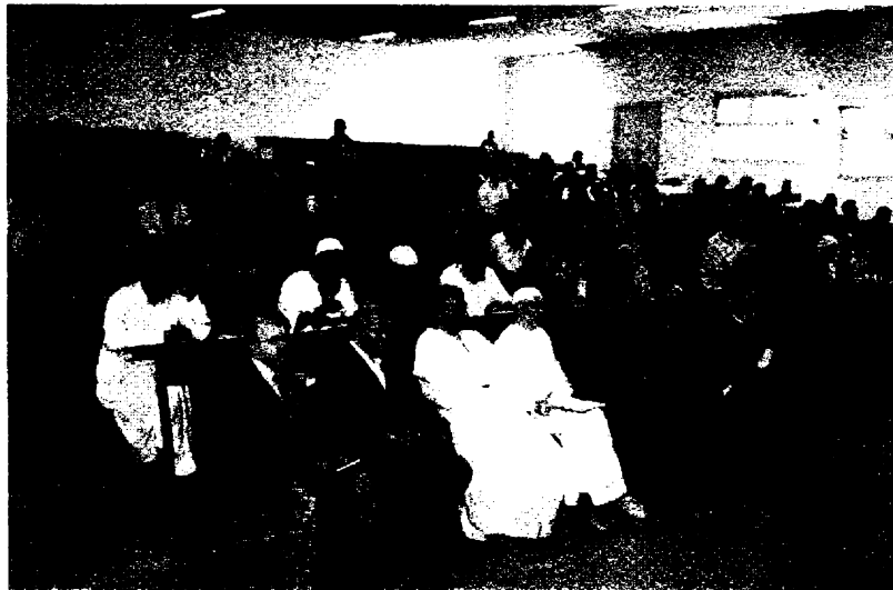
صورة جانب من الحضور الكريم